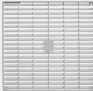
Abb.: LF 30