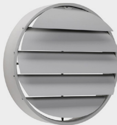
Abb.: WSKR 40